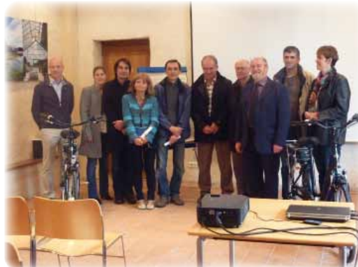
Remise des Trophées du Concours La maison économe